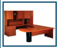
• Sistemas Modulares